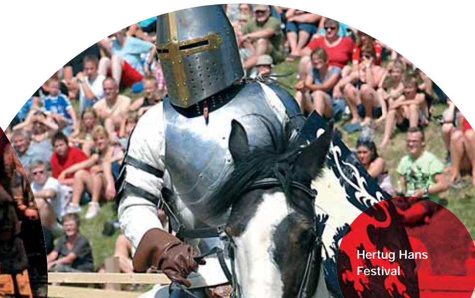
Hertug Hans Festival